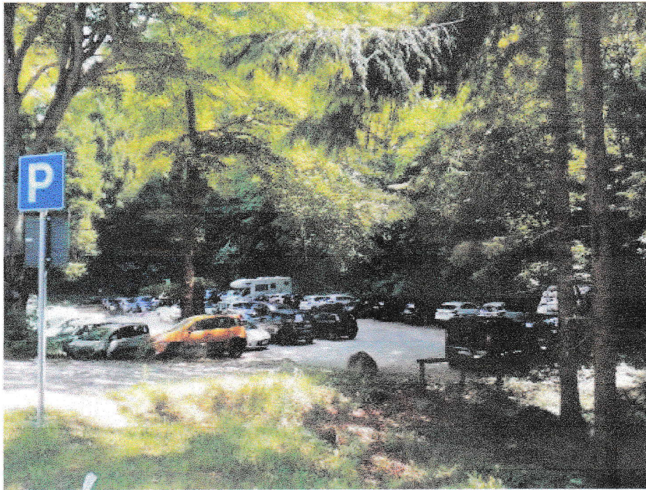
Foto 4 – Parcheggio lungo la strada sterrata completo ore 11.20 del 03.06.2017